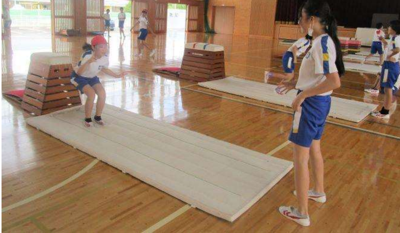
開脚跳びの着地でじゃんけんぽん！