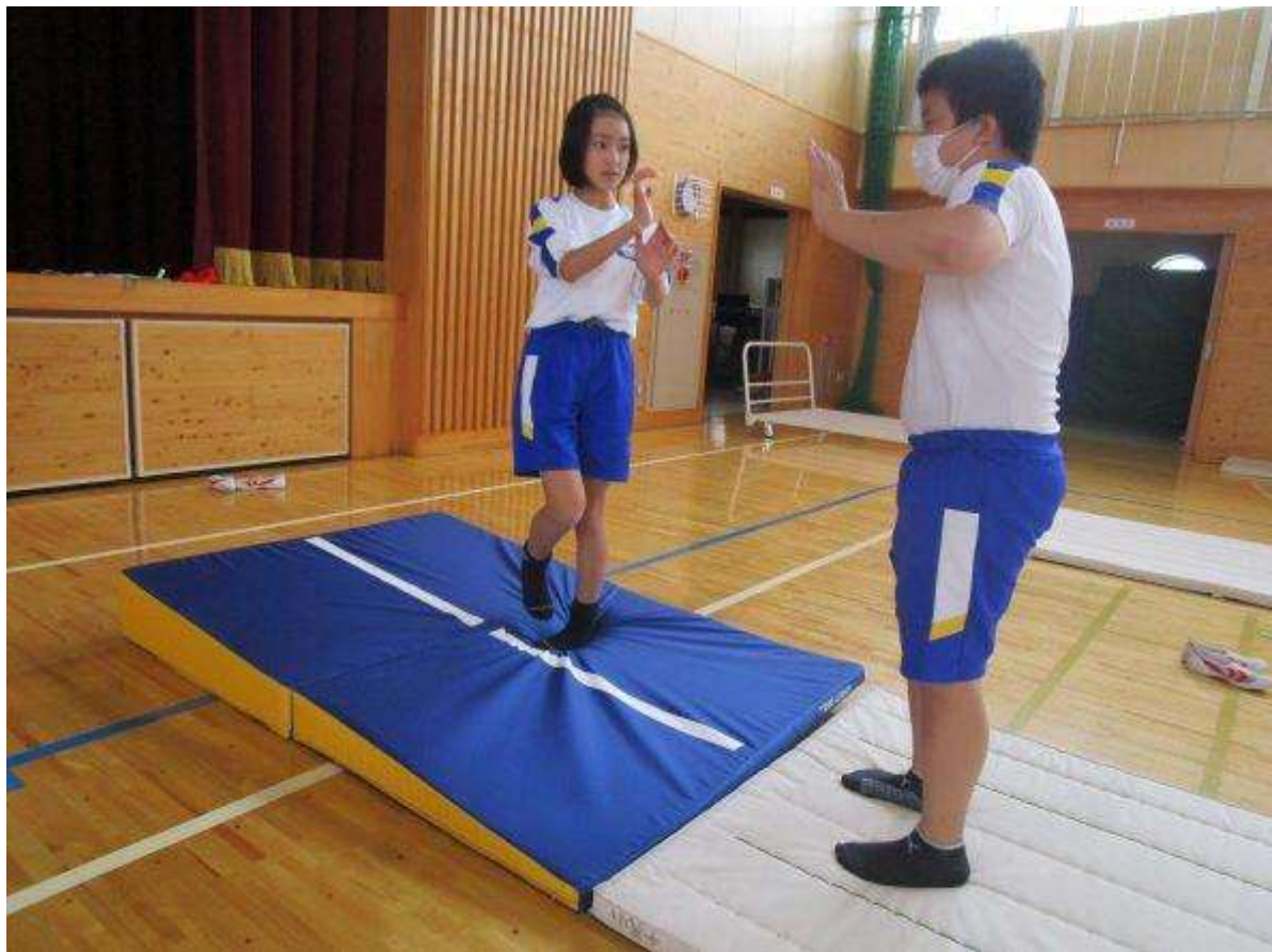
手の付き方についてアドバイス。