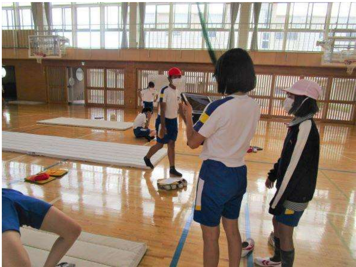
ipadで取り合いながら、自分の動きを確認。