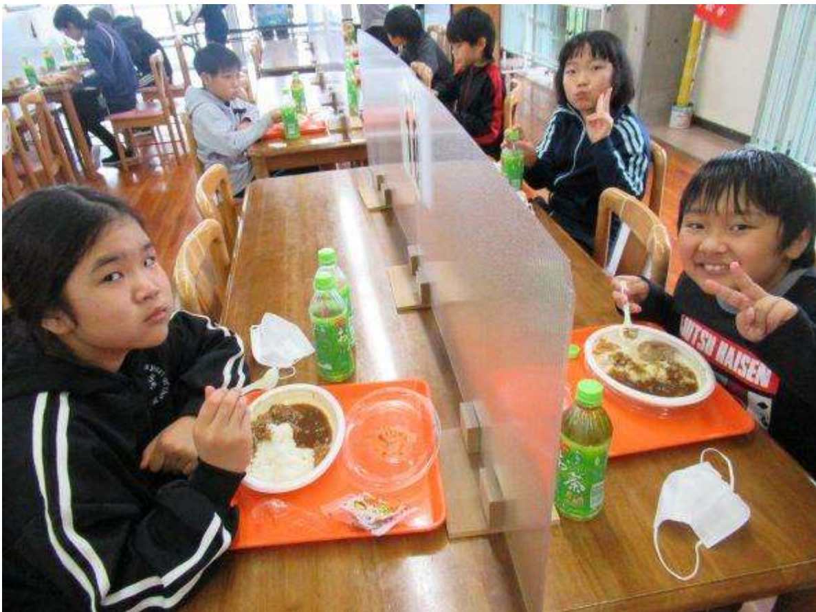
おいしくて、いい笑顔です。