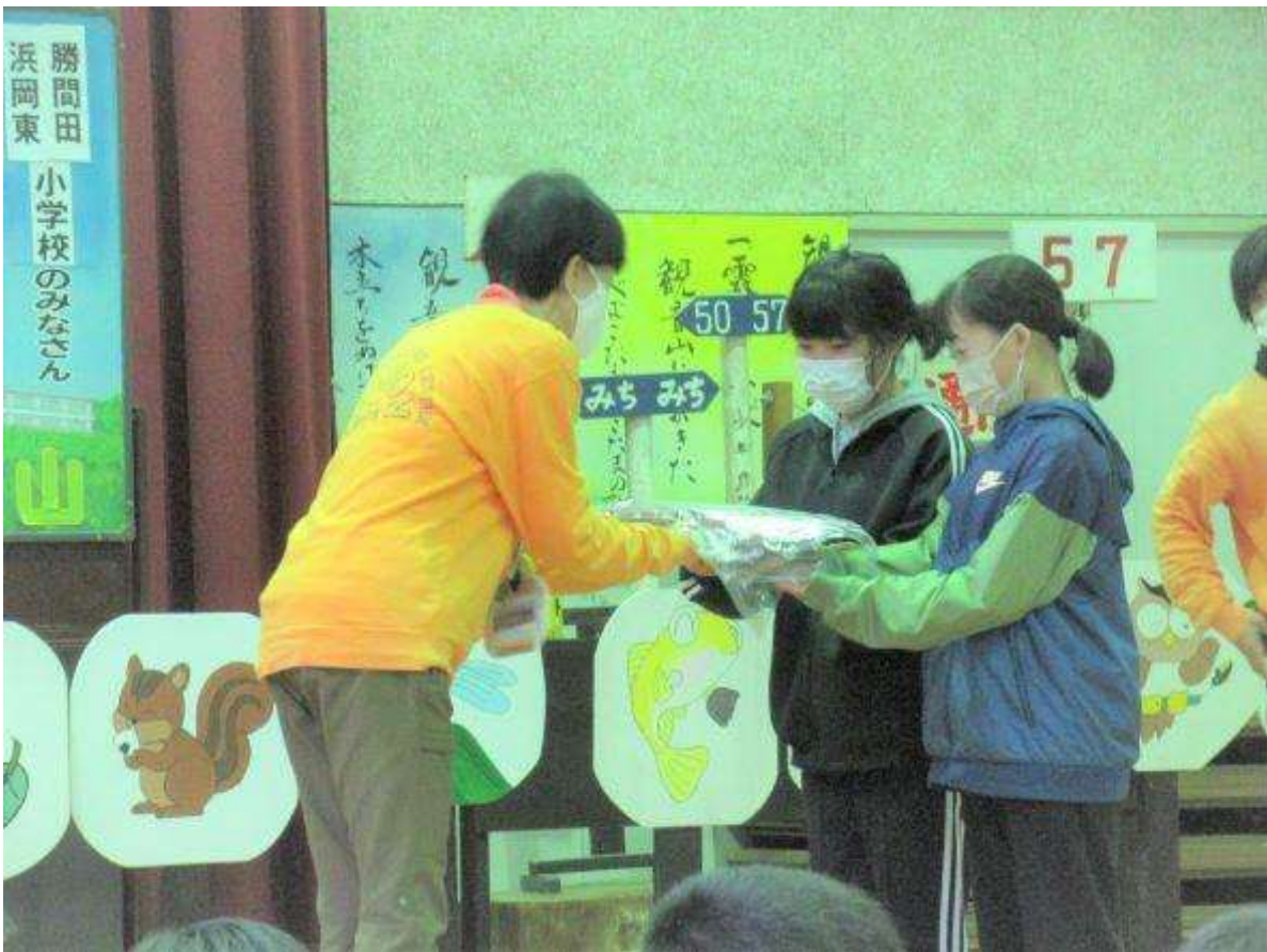
大坂小とのお別れの集い。