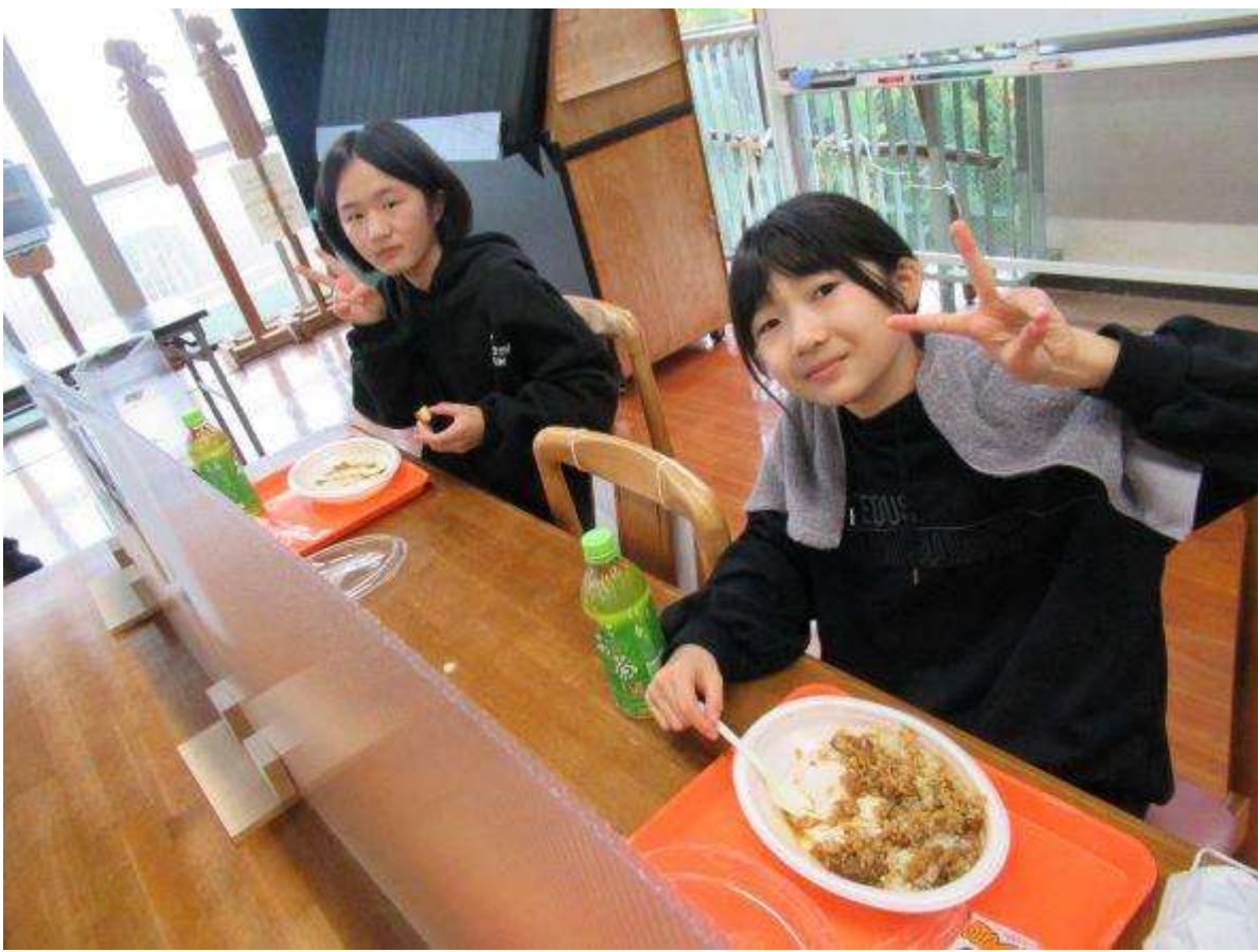
昼食はおわカレー！！