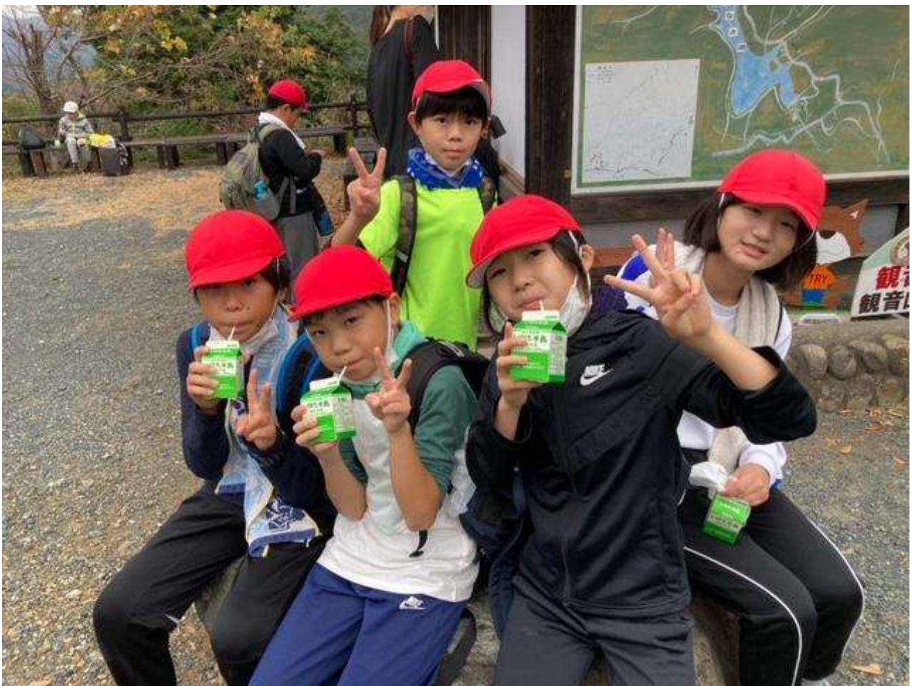
登り切った後の牛乳の味は、格別！！