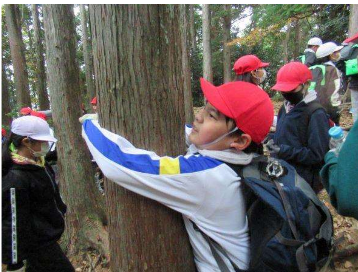
山頂登山の続きから。