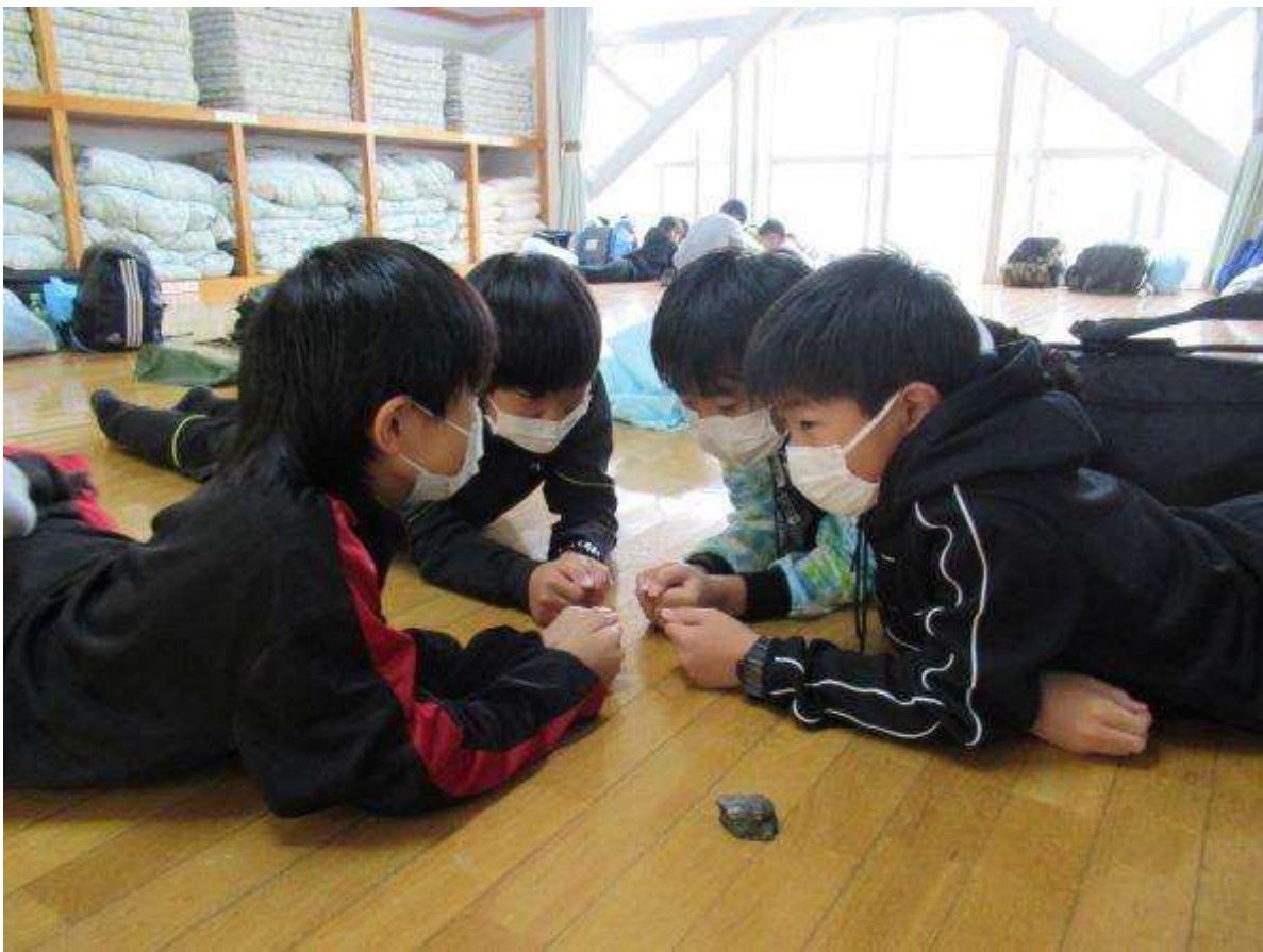
みんなで楽しくゲームをしています！！