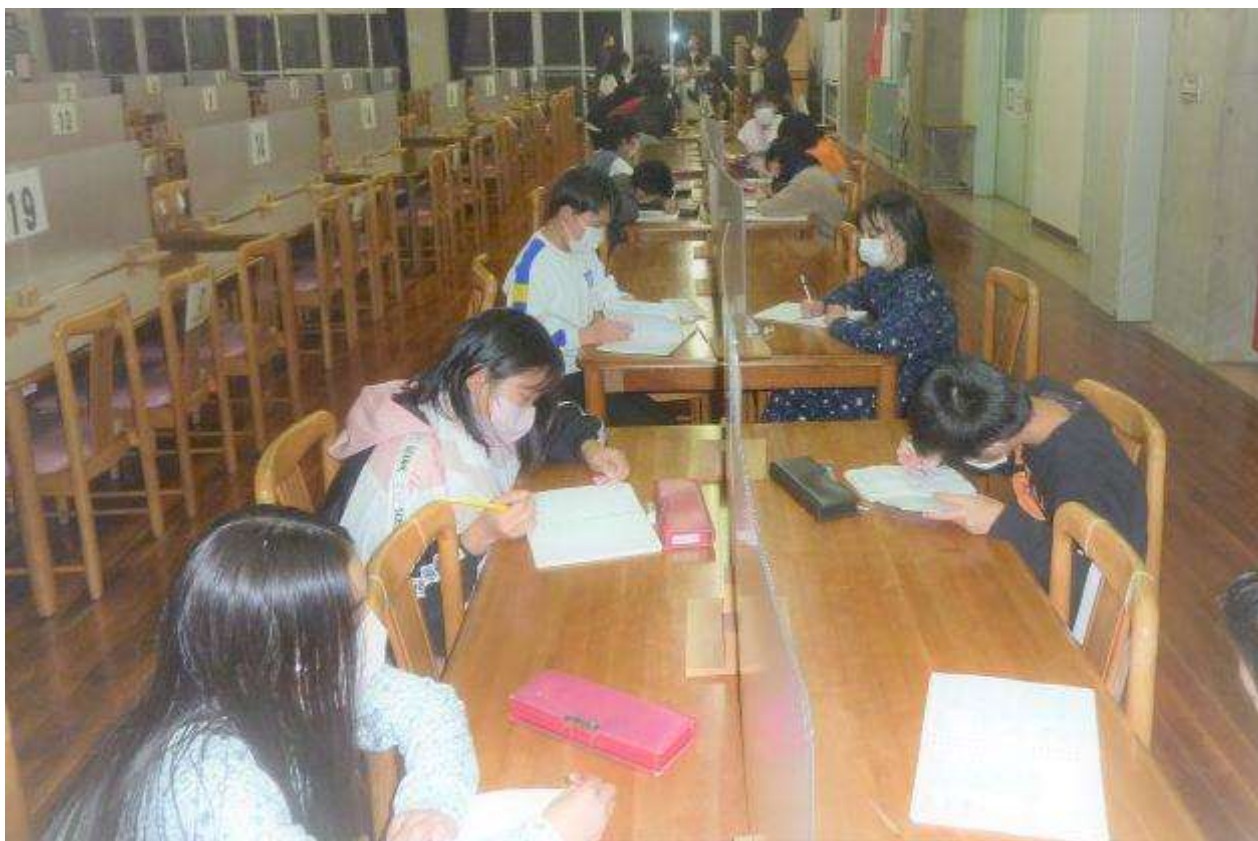
今日の活動中。ナイトウォークラリー楽しかった！！