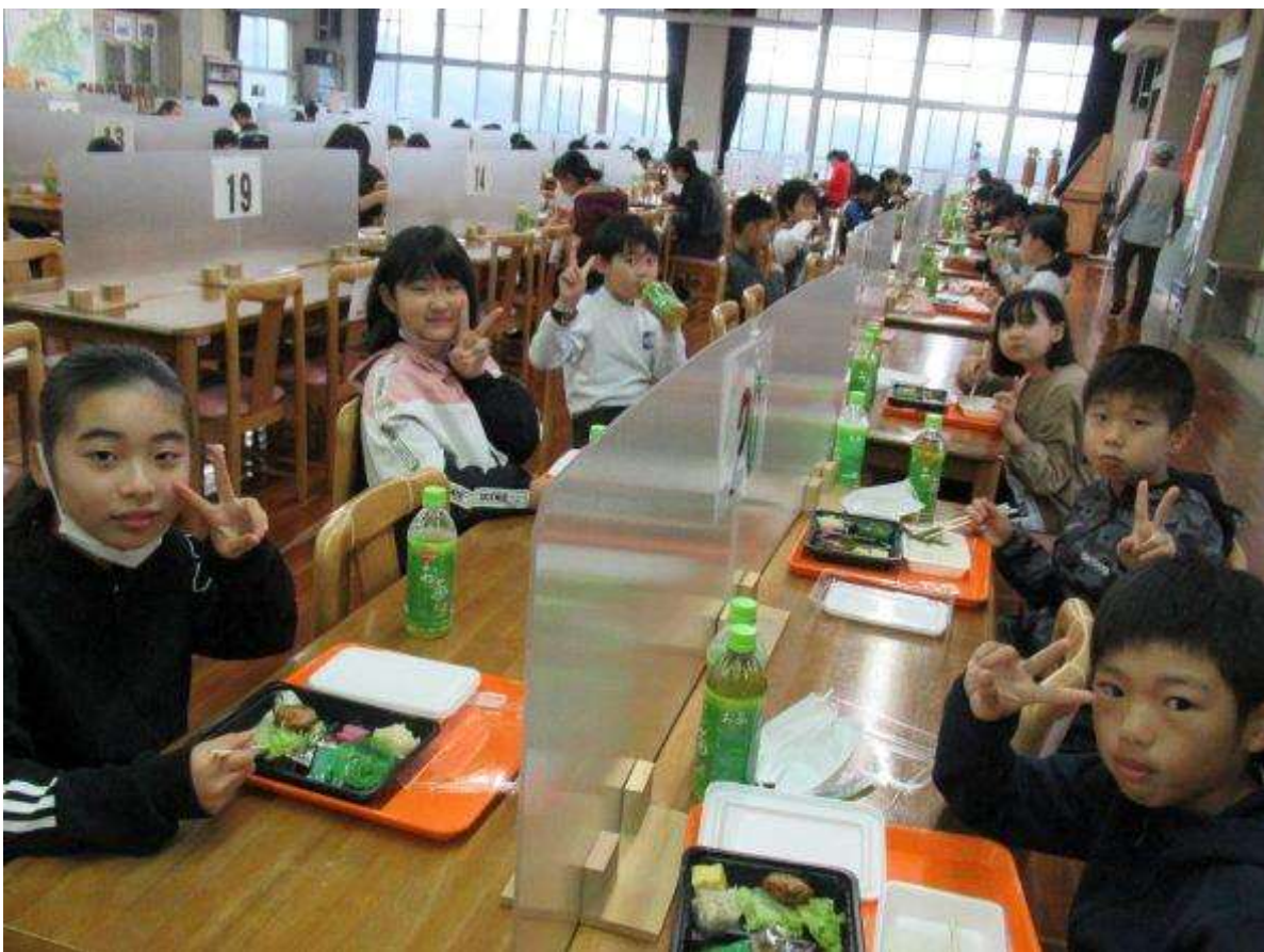
2日目の朝食！！おいしくいただきました！！