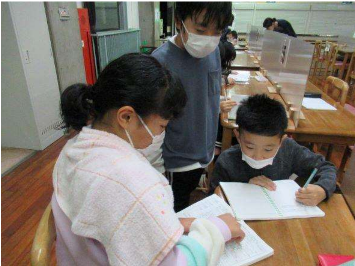
次の日の活動を確認してます。