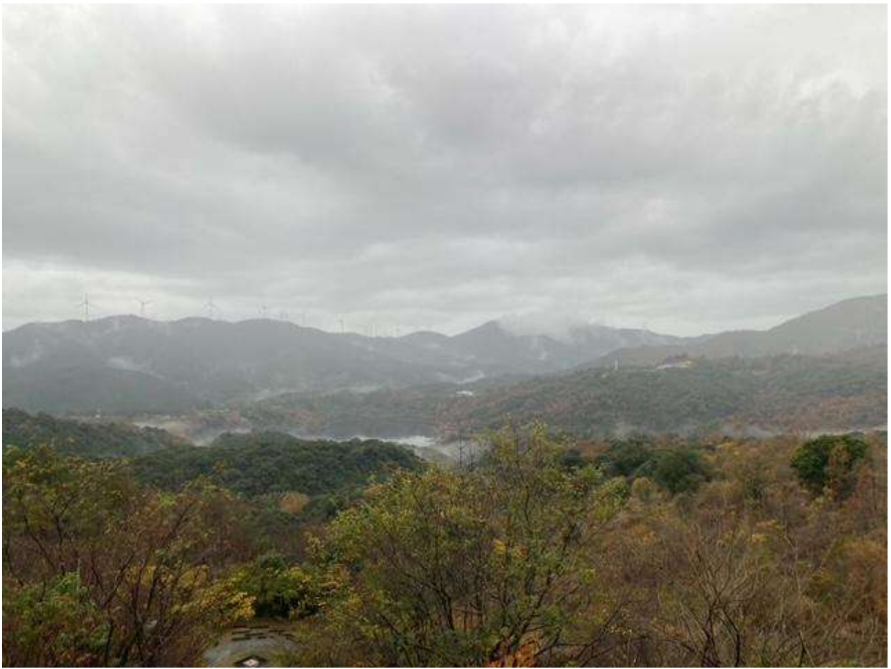
宿舎からの朝の景色！！